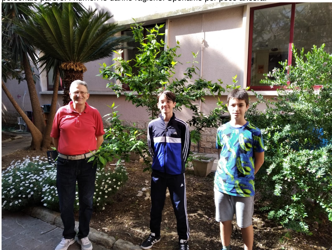
Nel giardino della scuola Savio, i ragazzi premiati e il loro insegnante di matematica e scienze 14 maggio 2024

La prof.ssa Anna Brancaccio, dirigente del ministero presente alla cerimonia di premiazione, ha notato e rimarcato che la maggioranza dei premi è andata al Nord ed ha spiegato il fenomeno con la maggior propensione delle scuole del Nord a mettersi in gioco, ovvero a darsi l'organizzazione necessaria per ottenere risultati di rilievo. Questo il suo personale parere. I numeri le danno ragione. Speriamo per poco ancora!