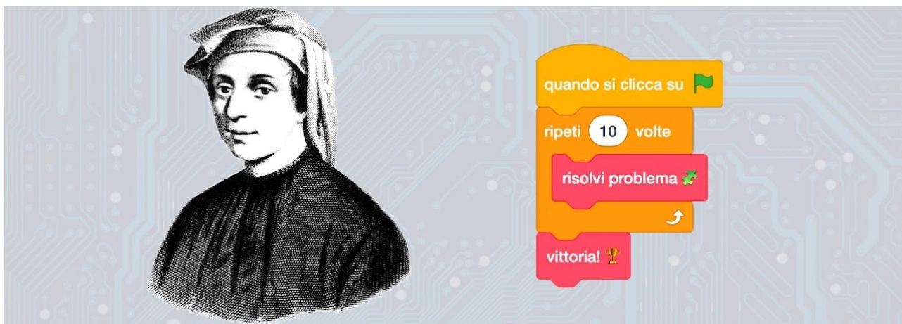
banner dei giochi

In realtà la scrittura di programmi per computer, oltre ad aver radicalmente modificato la società nella quale viviamo, si è sempre palesata come un'attività intellettualmente gratificante che mette a dura prova le capacità logiche, sia degli adulti che dei ragazzi, e che sviluppa non solo la stessa logica ma anche tante altre capacità, come l'osservazione, il buon senso, la capacità di fare sintesi, la pazienza ed altre ancora. Ci sono tanti buoni motivi per stimolare i nostri ragazzi a programmare, che non significa farli diventare programmatori per professione.